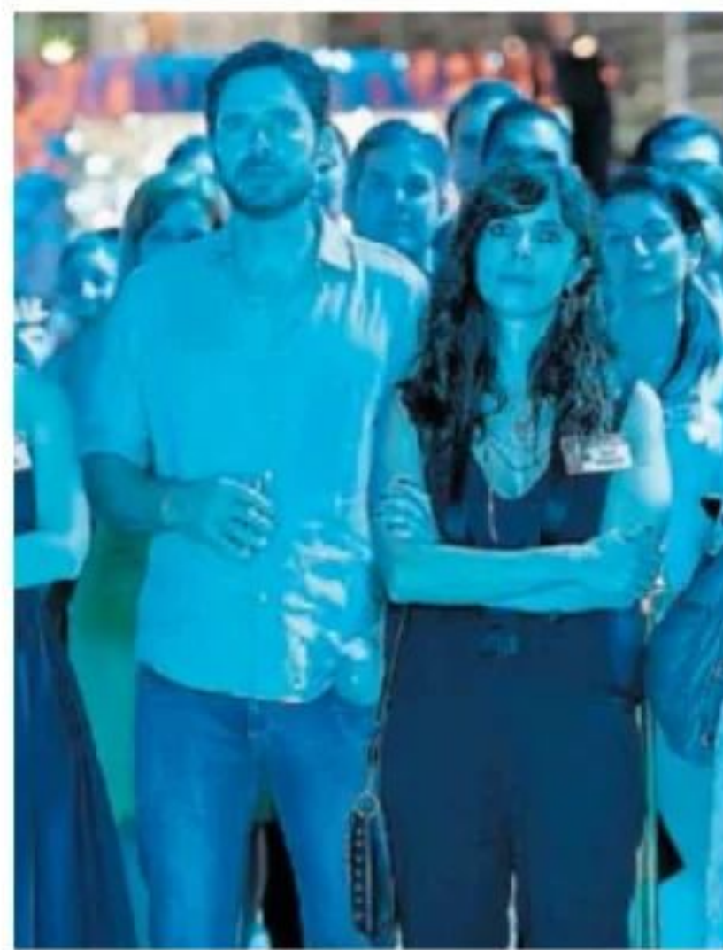
Manolo Cardona y Maribel Verdú, en un momento de Now & Then .

En cuanto al año de producción, destacan los contenidos de la década de 2010. Las películas y series españolas producidas antes