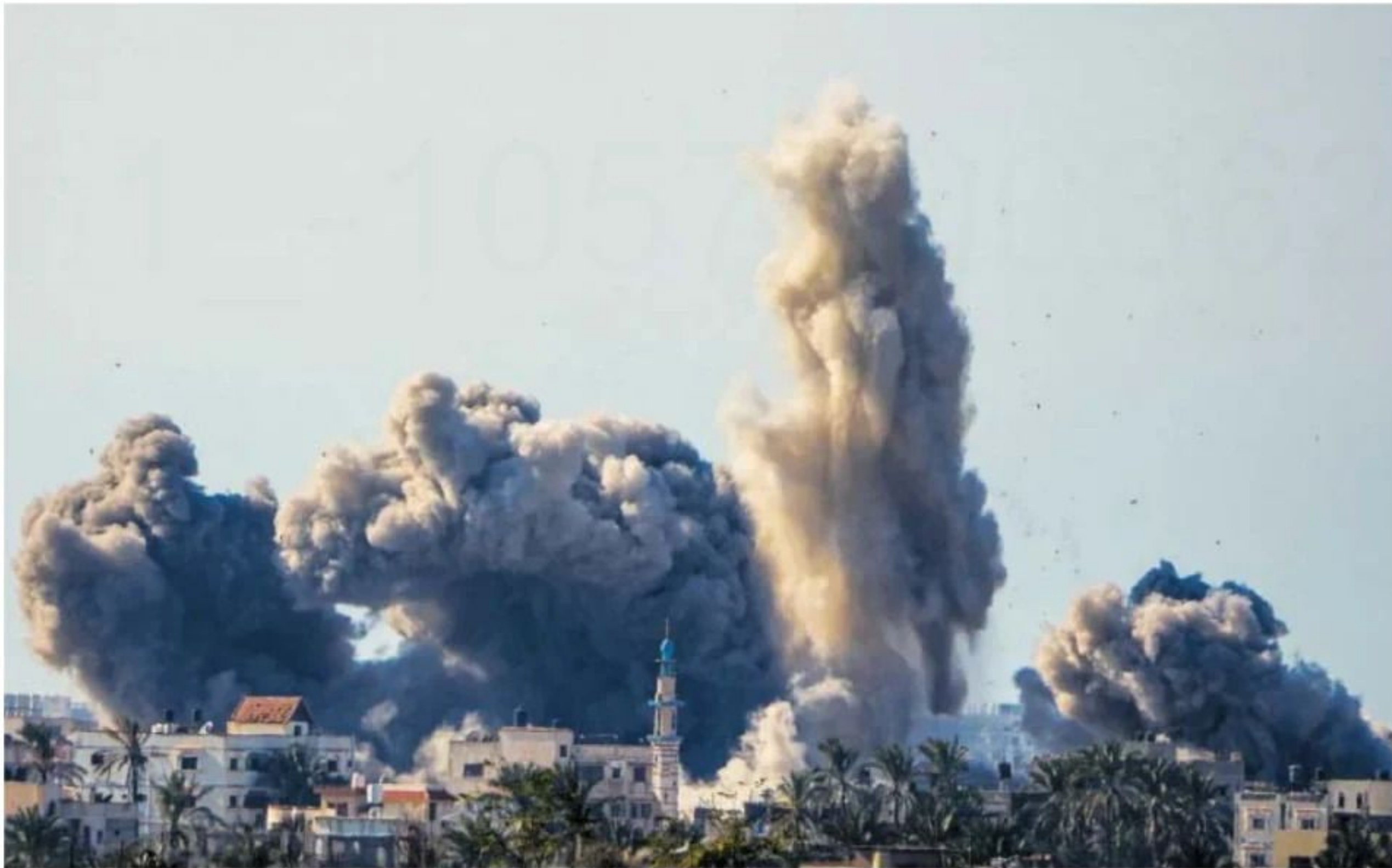
Columnas de humo tras un bombardeo de Israel en la franja de Gaza, ayer.

Y, como amenaza cada semana el ministro de Defensa, Yoav Gallant, solo sucederá de dos formas: por medio de la diplomacia (varios países negocian entre bambalinas un acuerdo para alejar a Hezbolá de la frontera) o por la fuerza de las armas. Moody's, de hecho, ve "significativo" el riesgo de un conflicto a gran escala con Hezbolá, una milicia mucho más nutrida y armada que Hamás, "aunque ambas partes sean conscientes de sus muy negativas consecuencias".