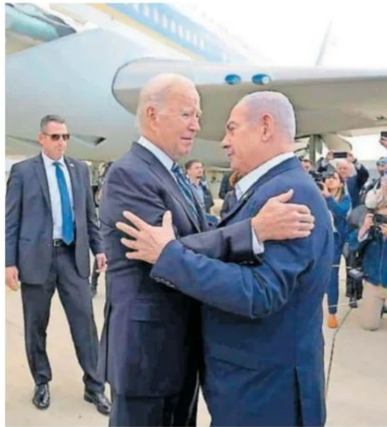
Netanyahu recibía a Biden en Tel Aviv, el 18 de octubre.

Putin suele decir que no tiene intención de atacar otros países. Lo reafirmó con Tucker Carlson. También negaba que atacaría a Ucrania. En el último foro de Valdai dijo: "Este no es un conflicto territorial y no es un intento de establecer un equilibrio geopolítico regional. Esta cuestión es más amplia y fundamental y concierne los principios subyacentes del nuevo orden internacional". Si esto va de supuestos principios, na-