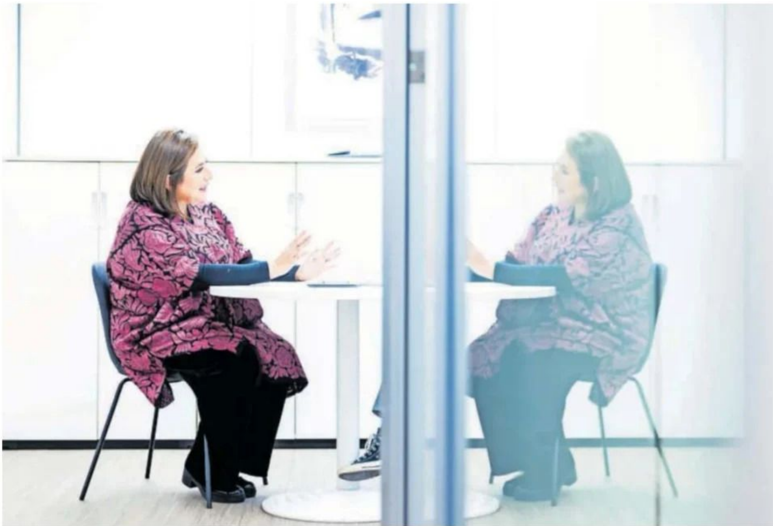
Xóchitl Gálvez, candidata a la Presidencia de México por el Frente Amplio por México, ayer durante la entrevista.

Xóchitl Gálvez Candidata por el Frente Amplio por México