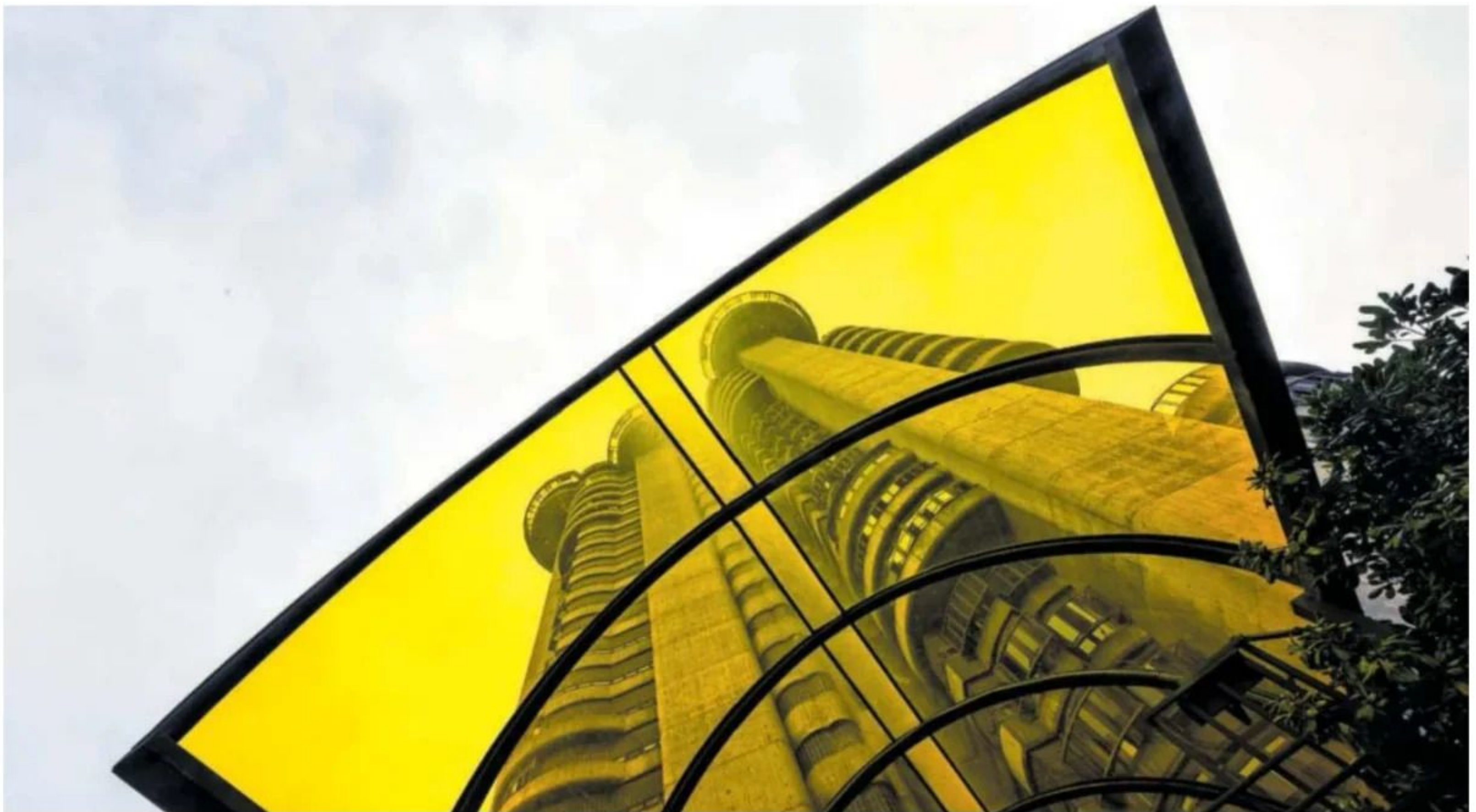
El edificio Torres Blancas de Madrid. CLAUDIO ÁLVAREZ