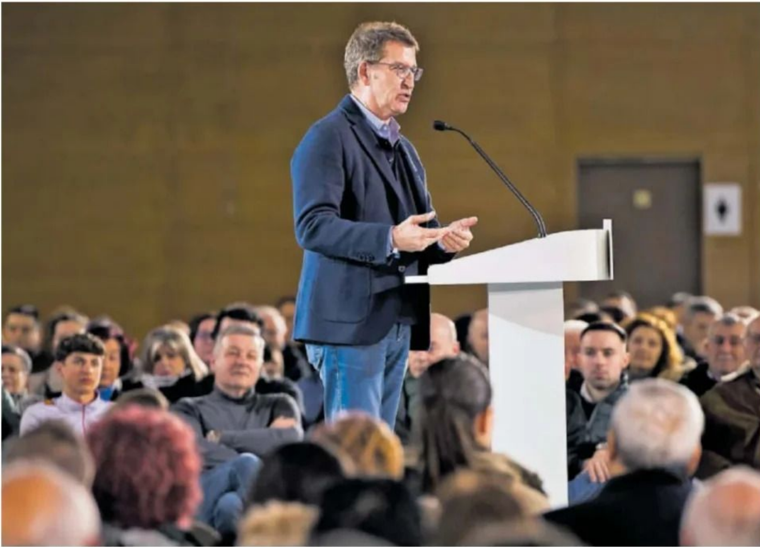
Alberto Núñez Feijóo, ayer en un mitin en Outeiro de Rei (Lugo).