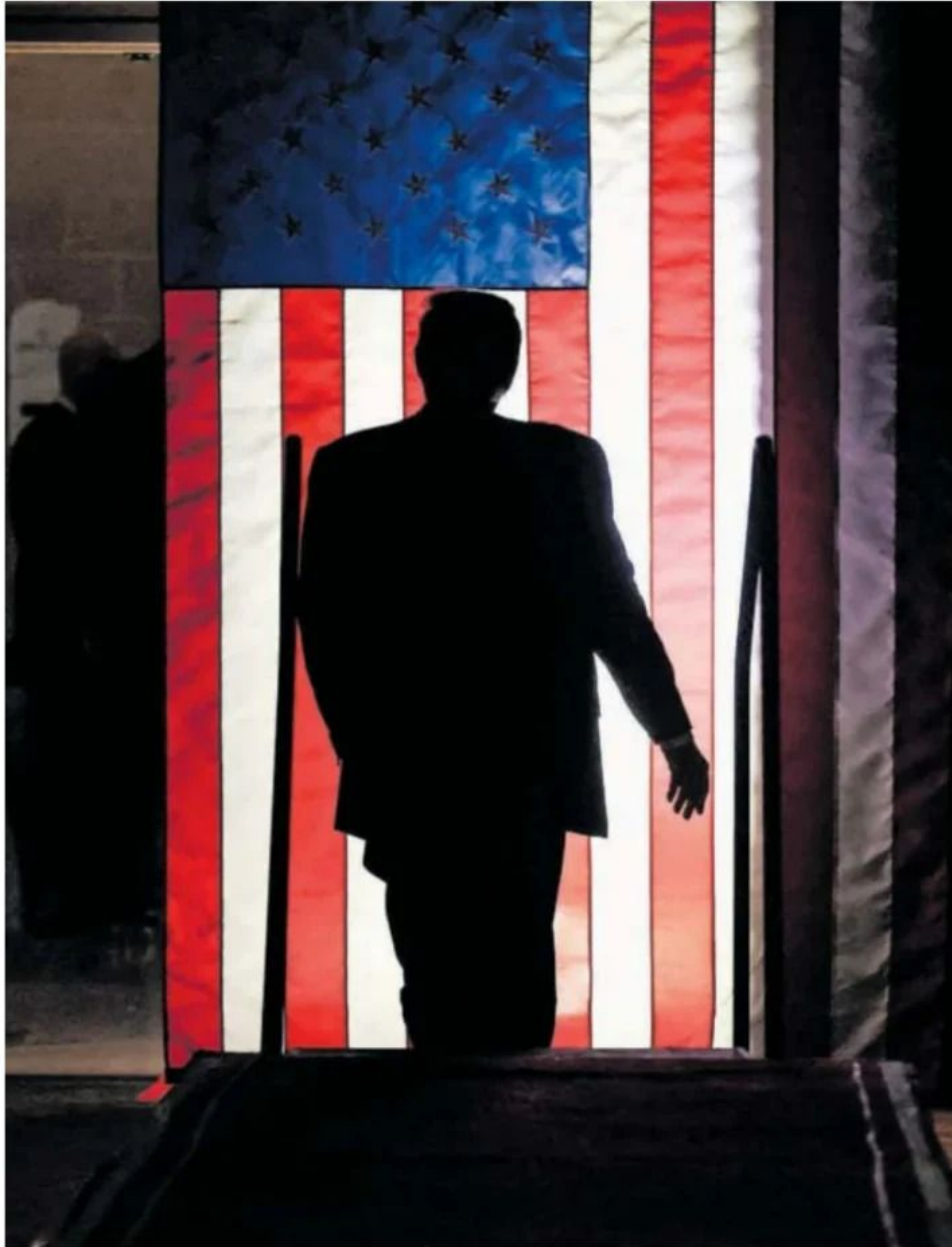
Donald Trump, en un mitin de las primarias en Conway (Carolina del Sur), el sábado.

Los comentarios de Trump meten de lleno a la Alianza en una campaña electoral estadounidense desbordante de animadversión. Y han reabierto la incertidumbre en Europa sobre el futuro de una institución clave en las relaciones transatlánticas desde la posguerra si el magnate inmobiliario regresa a la Casa Blanca, y lo fiable que pueda ser Estados Unidos como socio. El candidato