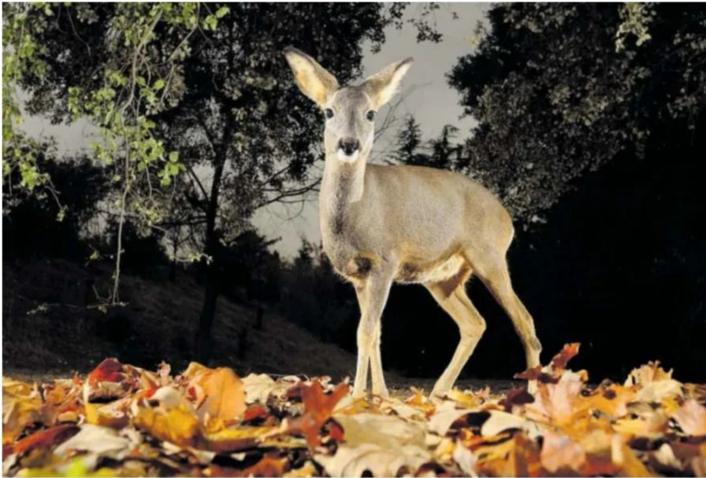
Corzo (' Capreolus capreolus '). Aparentemente parece disecado, pero nada más lejos de la realidad: se trata de un corzo vivo y coleante dentro del casco urbano de Alcalá de Henares.