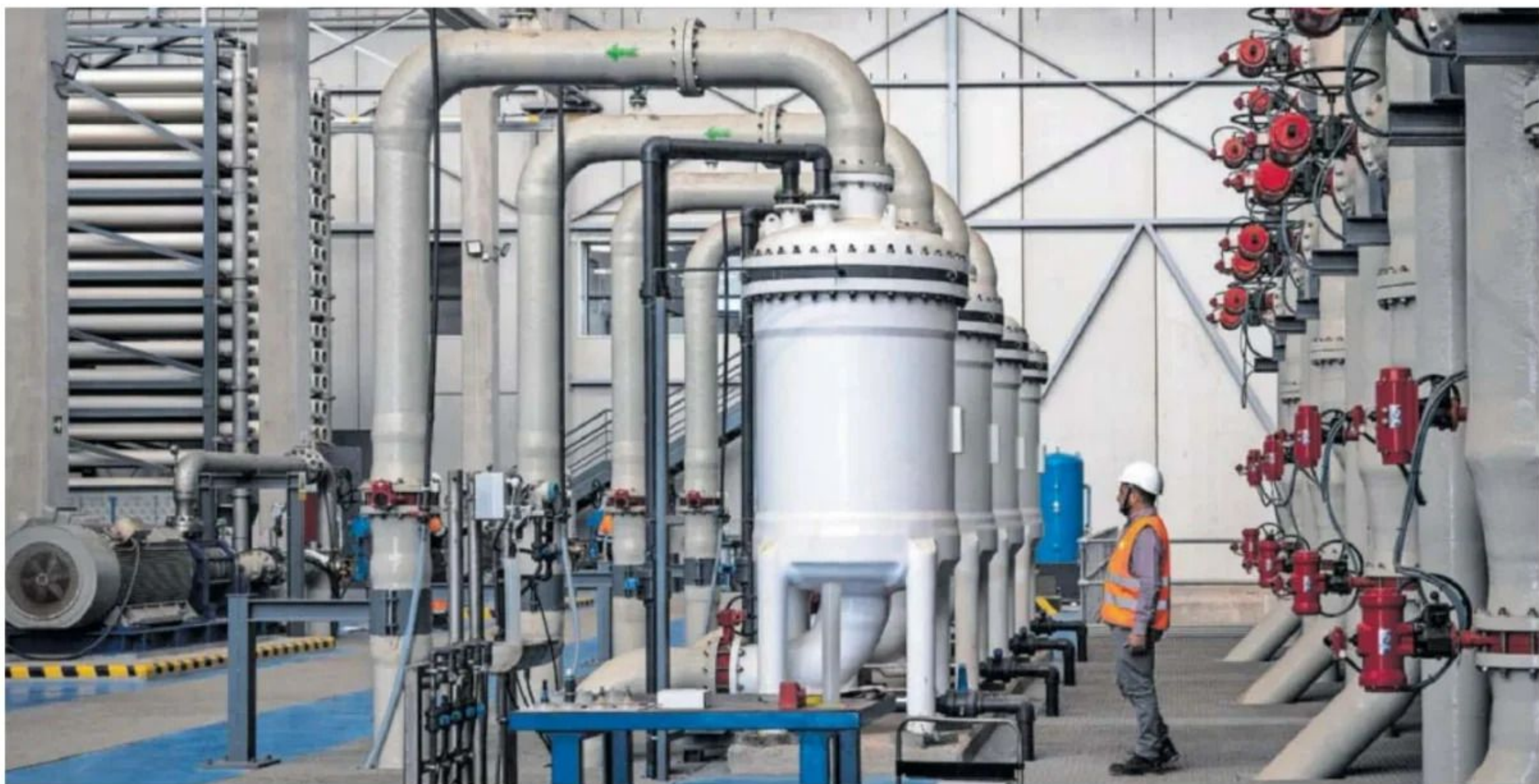
Un operario trabajaba el miércoles en la desalinizadora de Sagunto (Valencia).

La Comunidad Valenciana reclama trasvases pese a que es la autonomía con mayor capacidad de desalación