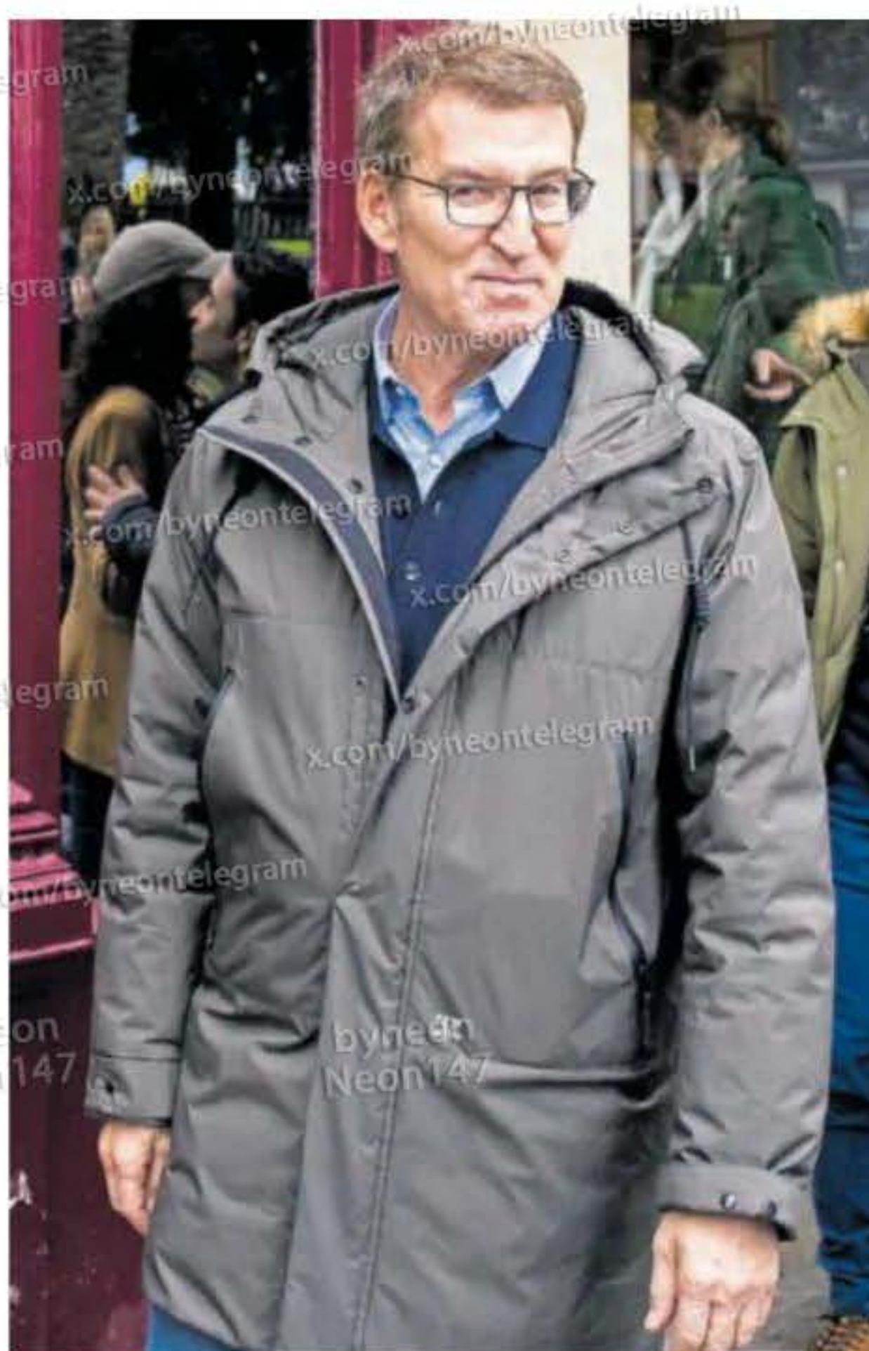
Alberto Nuñez Feijóo, ayer en Ferrol.