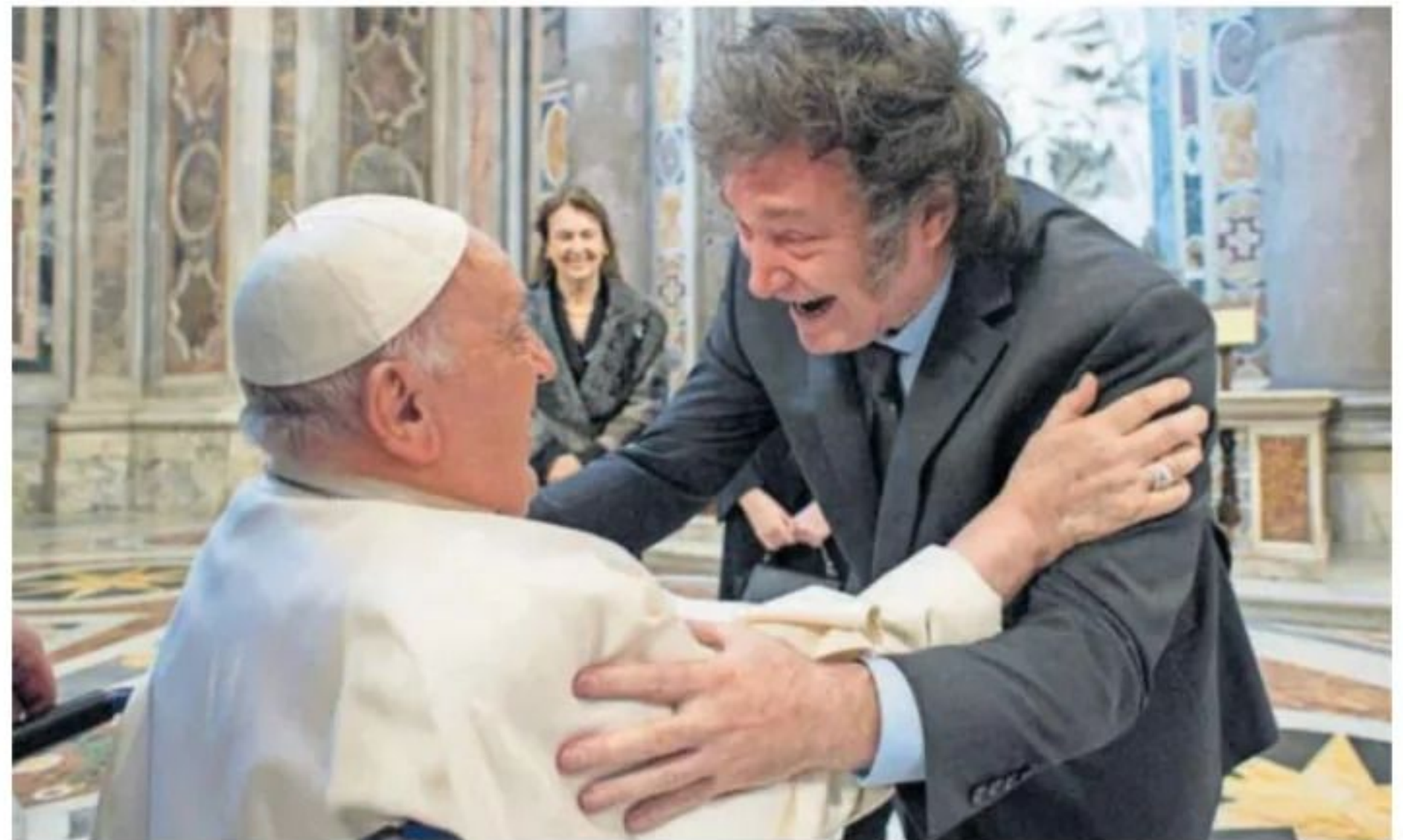
El papa Francisco y Javier Milei se abrazaban ayer en San Pedro, en una imagen del Vaticano.

El de ayer es el primer encuentro entre ambos y había generado una gran expectación. Milei había atacado en varias ocasiones a Francisco, alineándose con la corriente ultraderechista global, que siempre vio en Bergoglio un enemigo de sus intereses económicos y espiri-