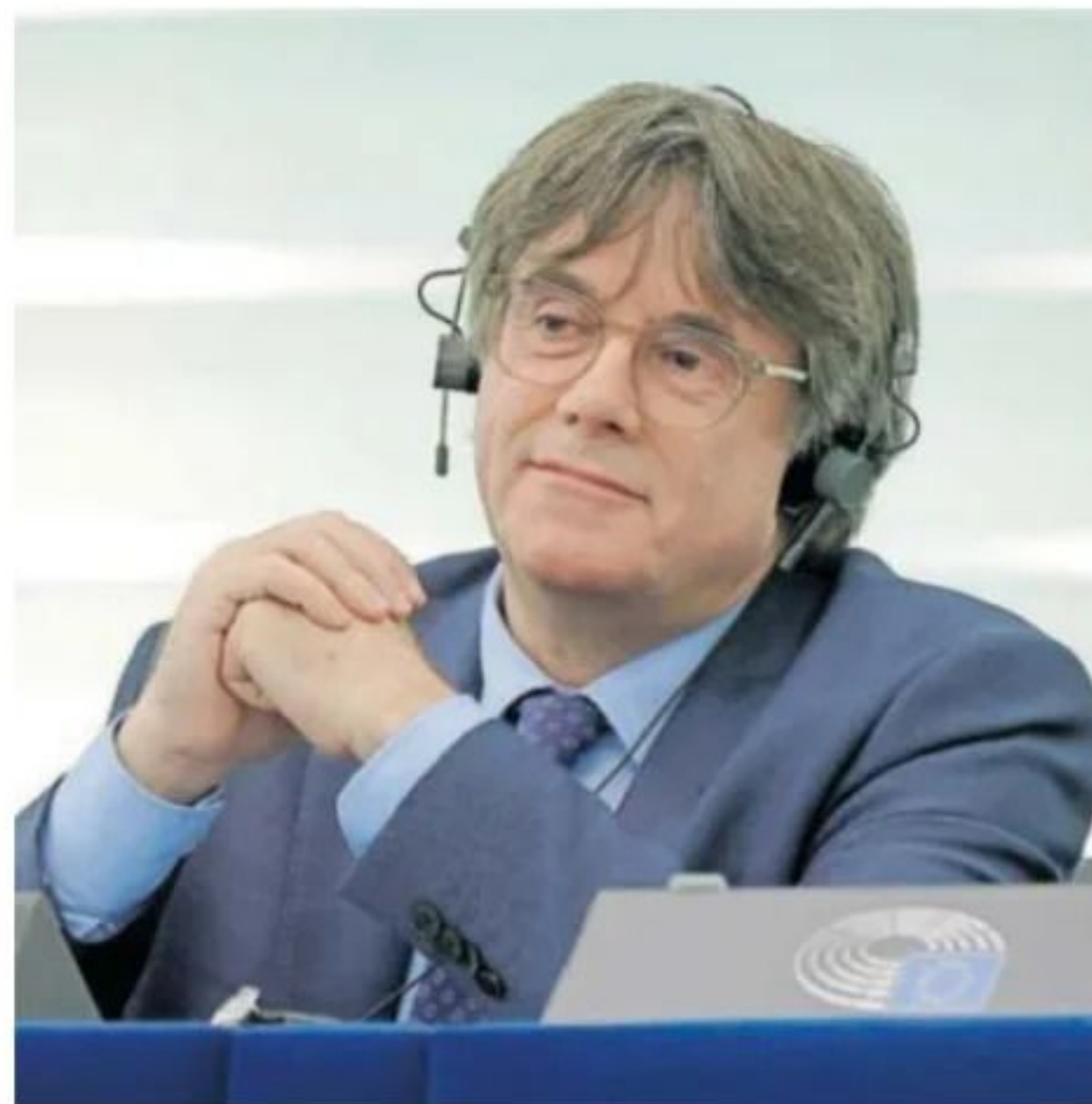
Carles Puigdemont, el 13 de diciembre en Estrasburgo.

Si desde que Sánchez empezó a negociar y a sellar pactos con Puigdemont para conseguir la presidencia, el PP se ha centrado en exclusiva a atacar al líder socialista por "vender a España", ahora el PSOE se toma la revancha. Las intenciones del PP, lleguen o no fraguarse, han quedado al descubierto en plena campaña electoral en Galicia. No es extraño, o, tenía que pasar, porque la amnistía a los independentistas catalanes, ha sido el argumento central de la dirección del PP en estos comicios autonómicos. Aún quedan cinco días de