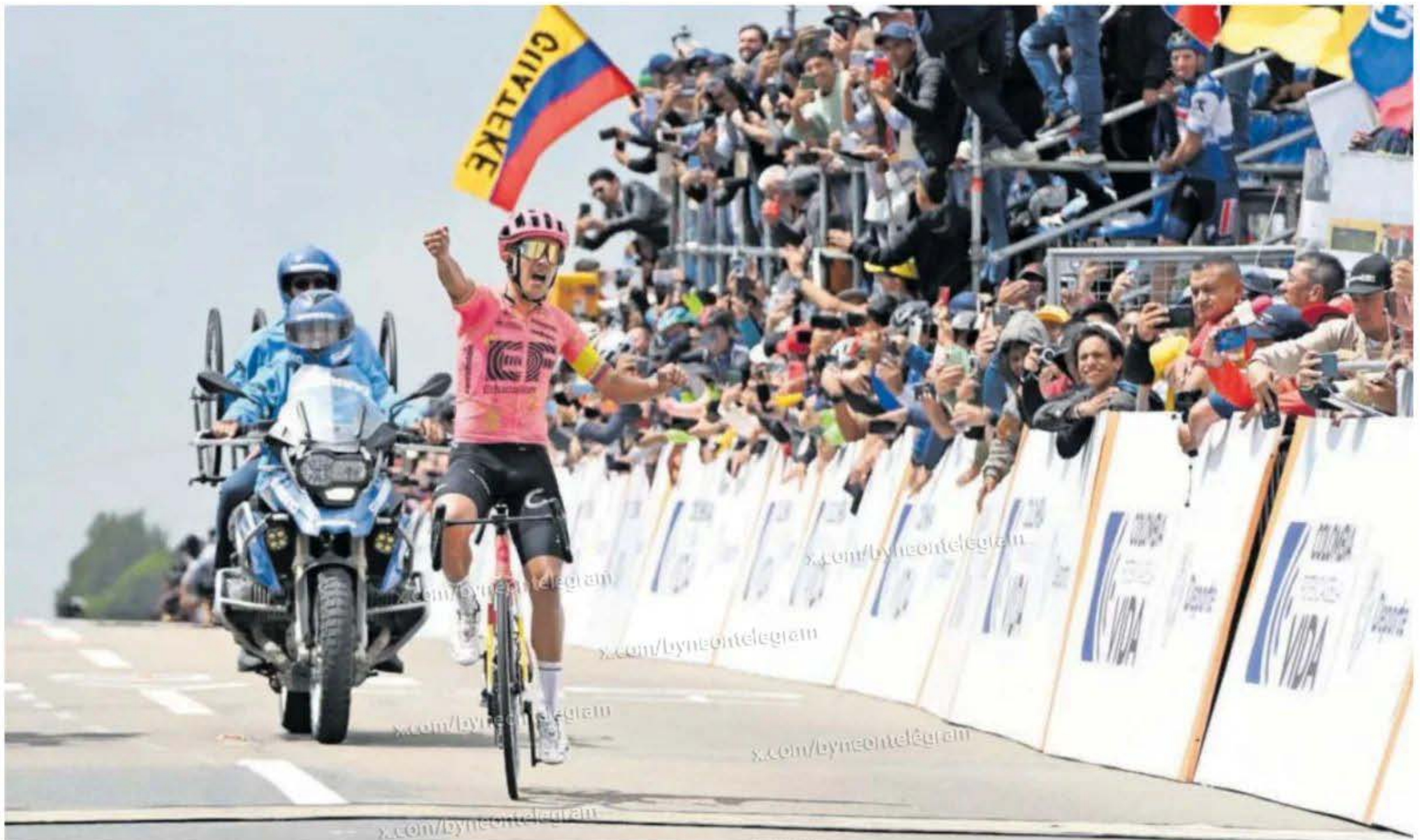
Richard Carapaz celebraba el sábado la victoria en Alto del Vino, en el Tour de Colombia, que concluyó ayer.