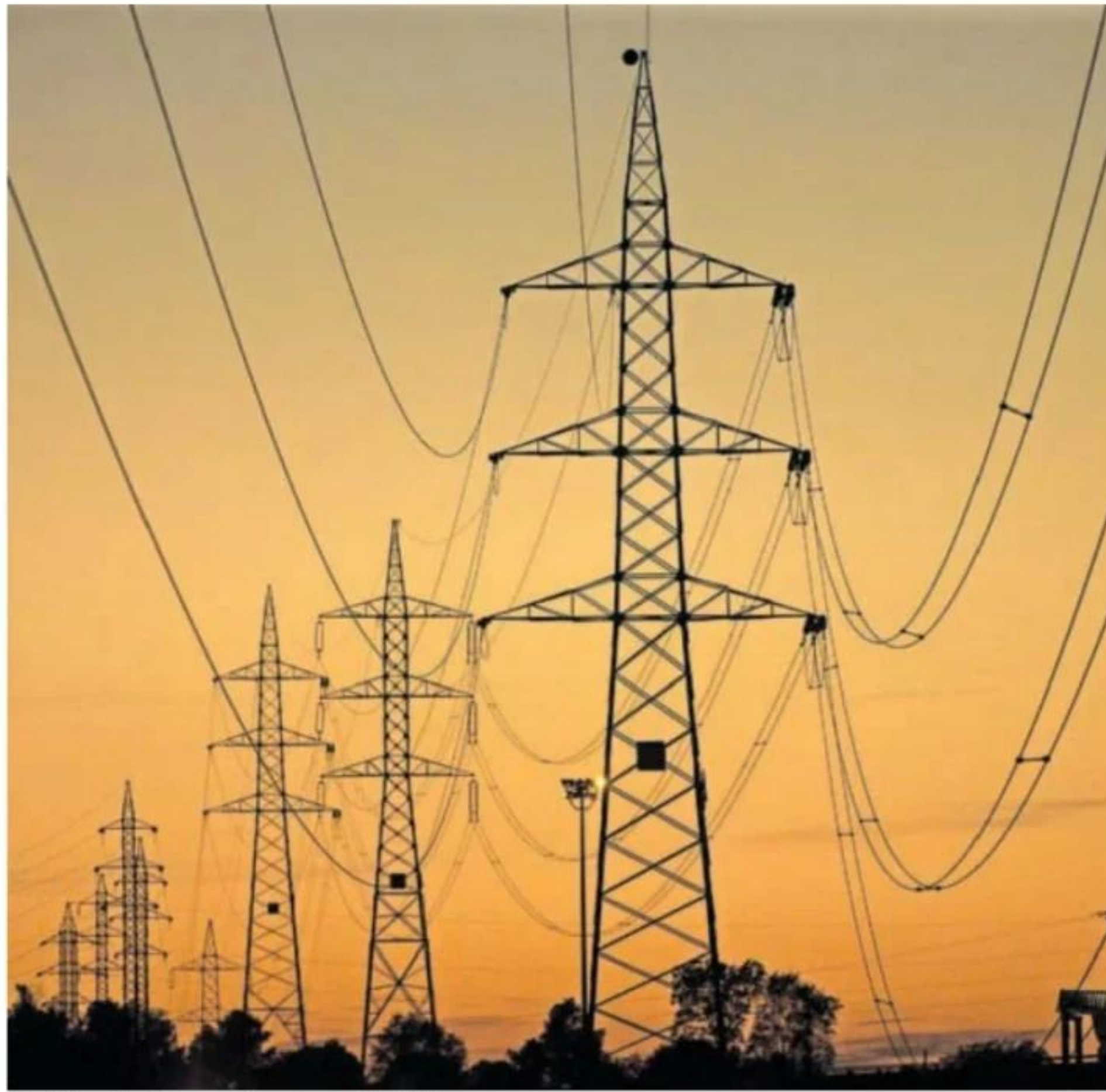
Tendido eléctrico en el norte de Madrid. LUIS SEVILLANO

En los nueve primeros meses de 2023 —el último periodo del