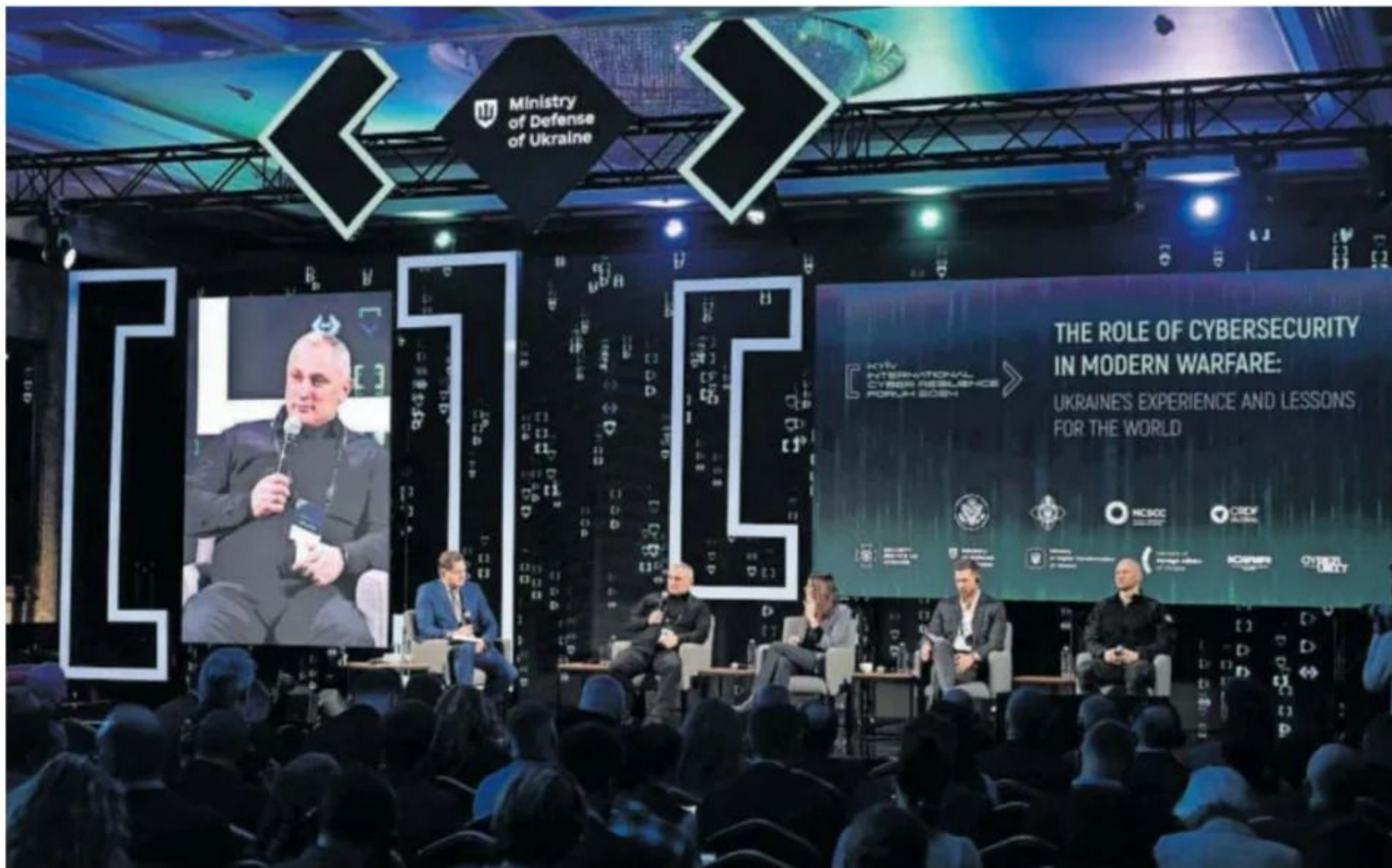
Participantes en el Foro Internacional de Ciberseguridad en Kiev, el miércoles, en una imagen de la organización.

El Gobierno estadounidense afirma que Pekín y Moscú han incrementado su cooperación en este campo