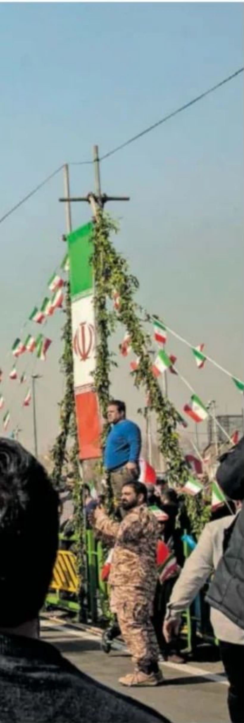
Celebración del 45º aniversario de la Revolución Islámica, ayer en Teherán.

confrontación ideológica. Hay democracias por un lado y regímenes por el otro, pero no es lo mismo. Y hay una interdependencia que entonces no había", comenta. "Pero sí hay cosas que se parecen: una es la lucha de poder entre potencias. Otra es cómo el espectro nuclear condiciona esa lucha", prosigue Radchenko.