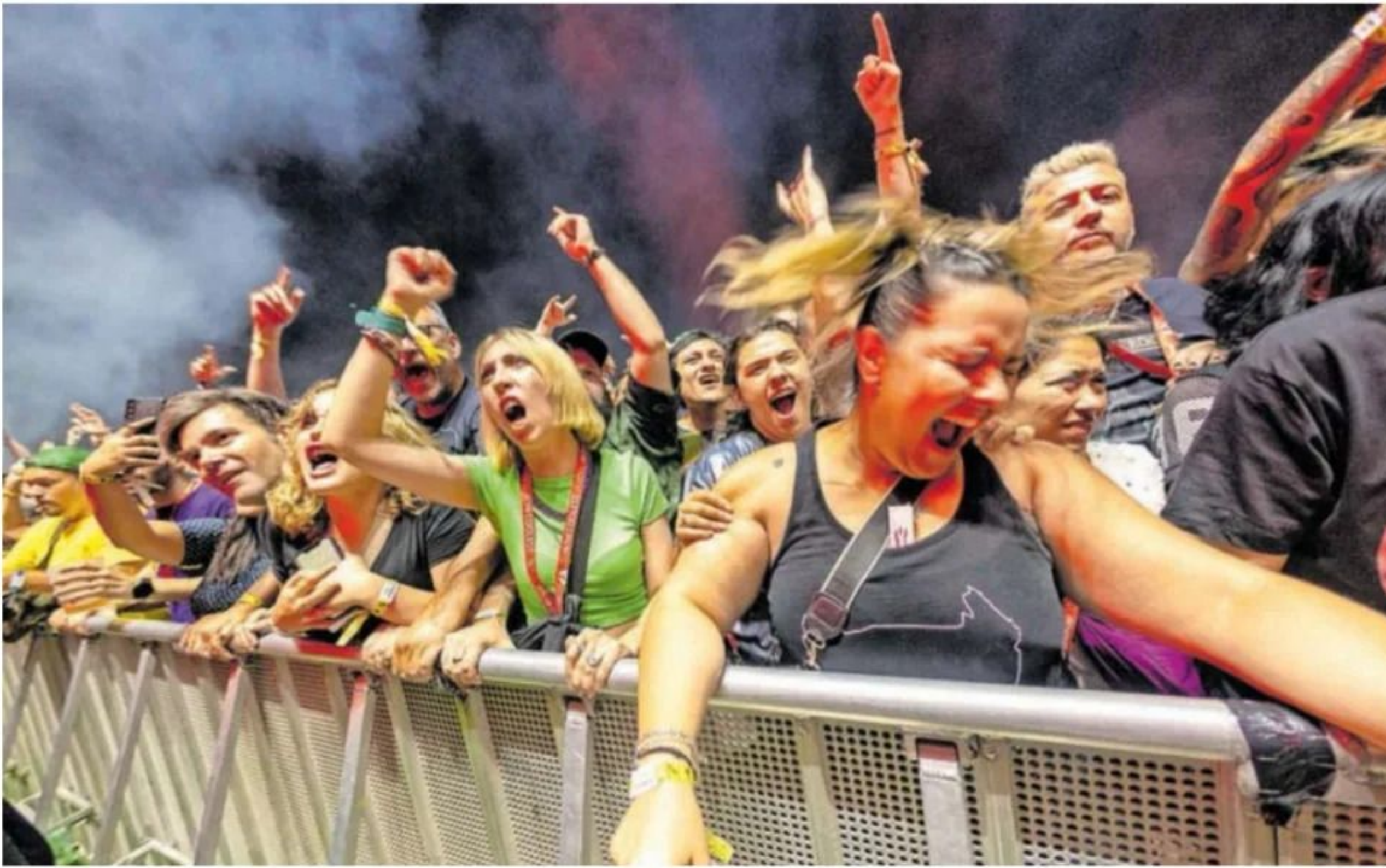
Fans de The Prodigy, en julio durante su actuación en el festival Mad Cool de Madrid.

Internet se llena de cuentas que escrutan el día a día de las celebridades. “Invierto muchas horas semanales creando contenido”, confiesa una seguidora de Rosalía