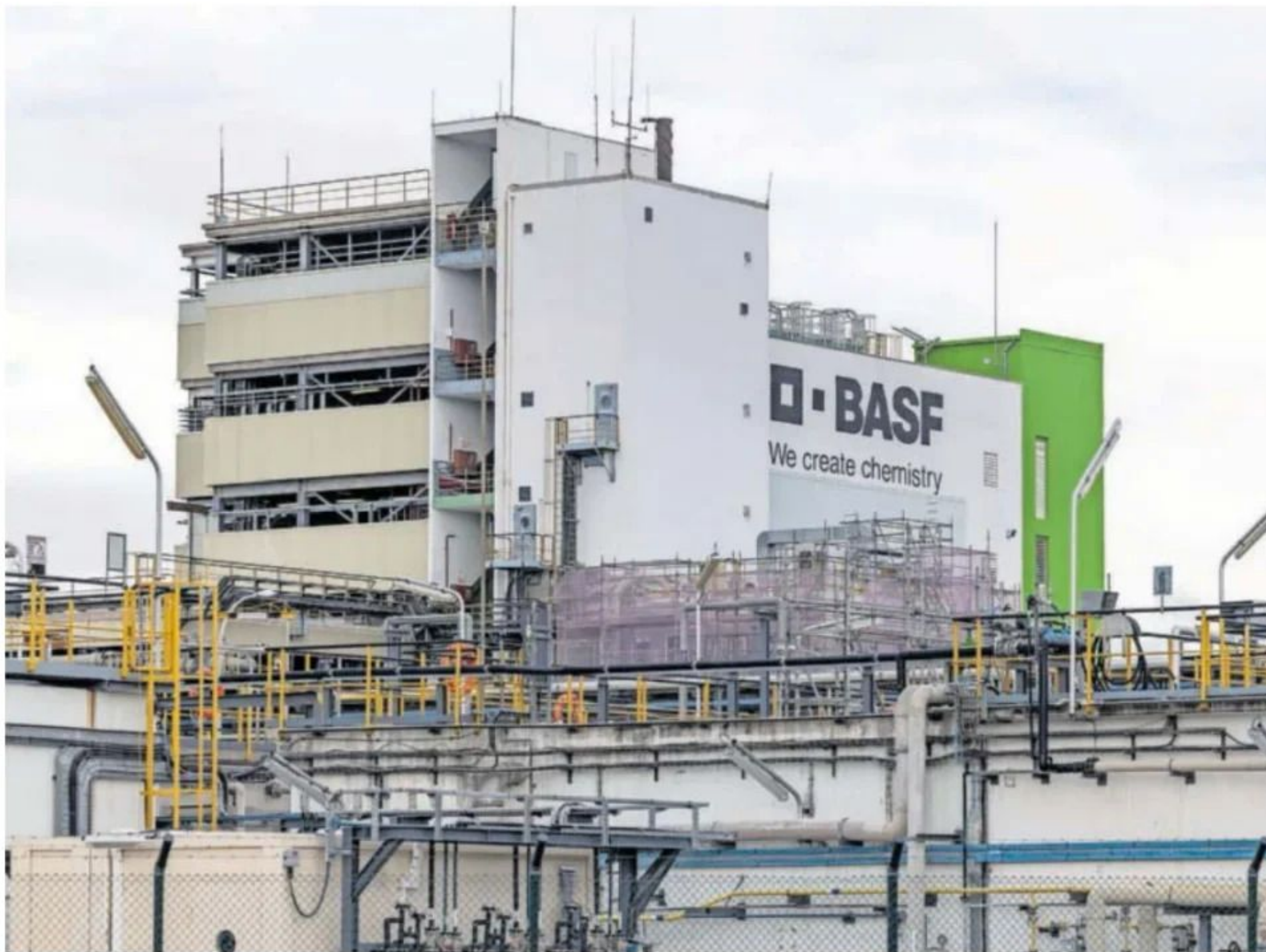
Planta petroquímica de Basf en La Canonja (Tarragona).