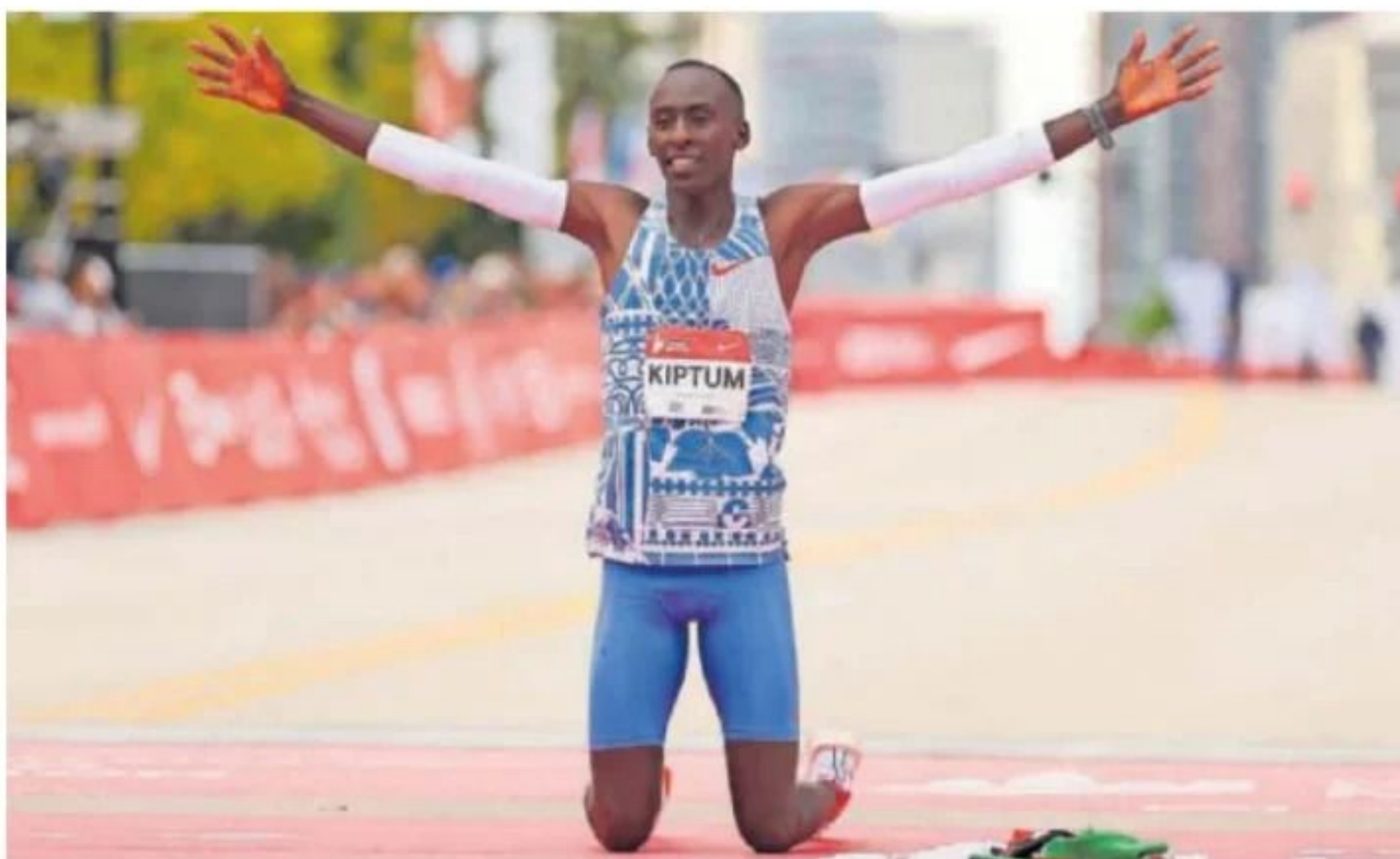
Kelvin Kiptum celebraba su triunfo en el Maratón de Chicago el 8 de octubre de 2023.

Y es que hace nada, ni cinco años, hablar de un maratón en dos horas era hablar de una fantasía, una utopía casi; una frontera del rendimiento lejos del alcance del ser humano a la que solo podrían