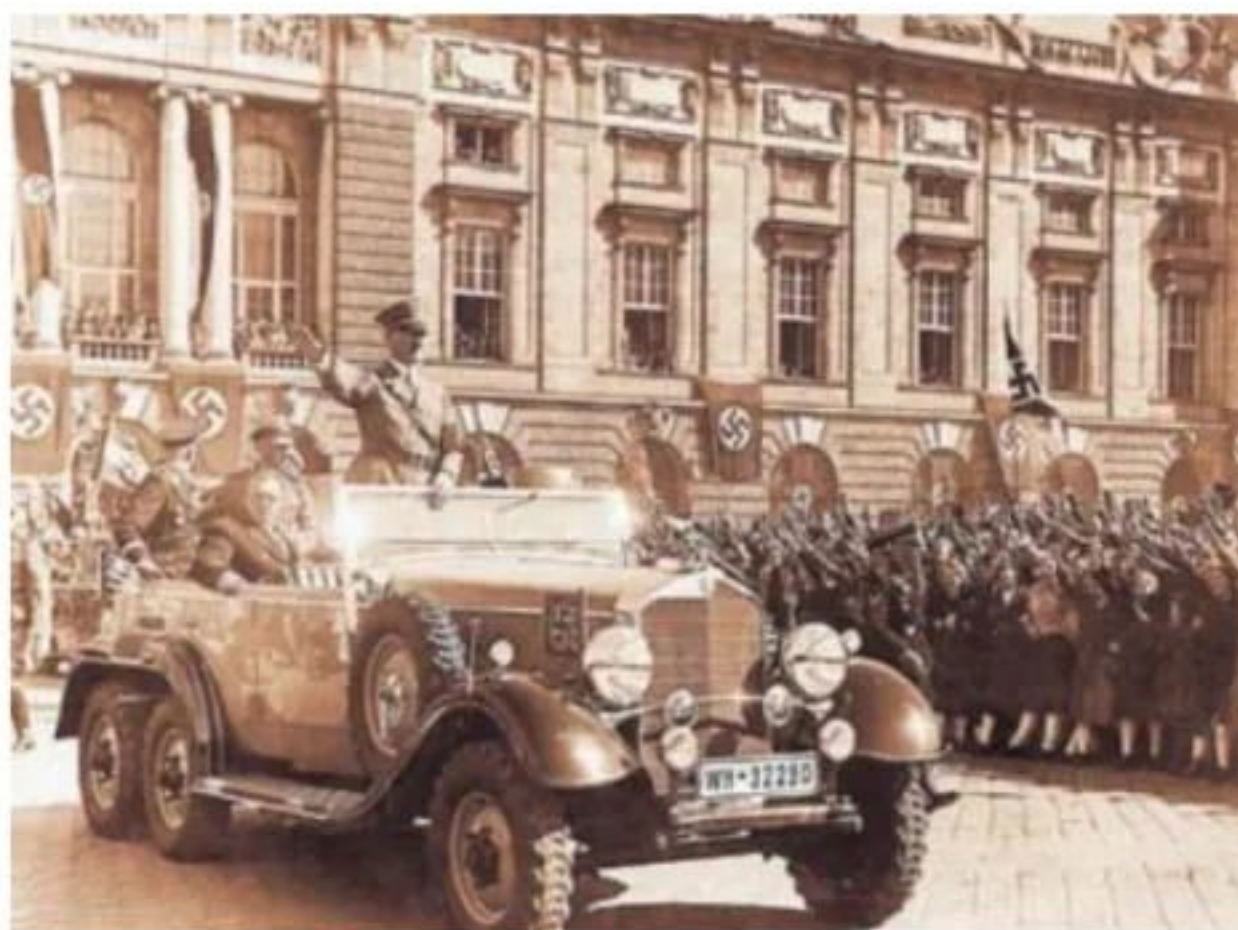
Adolf Hitler, a su llegada a la plaza de Héroes de Viena en 1938.